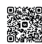
Видеoversия ТК «СвирьИнфо»