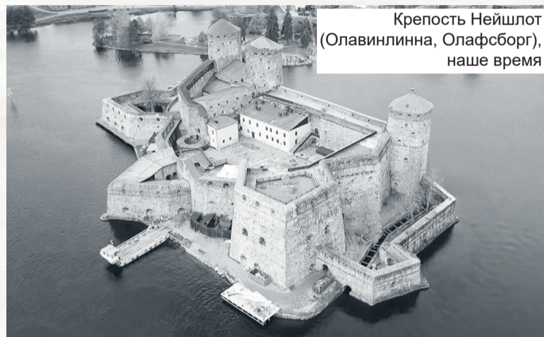
Крепость Нейшлот (Олавинлинна, Олафсборг), наше время

Шведские войска в Финляндии с конца июня 1788 года стояли под крепостью Нейшлот и вдоль реки Кюммене. В июле они начали наступление тремя колоннами: от Санкт-Микеля на Вильманстранд, от Кельтиса на Давыдов и от Абборфорса на Фридрихсгам.