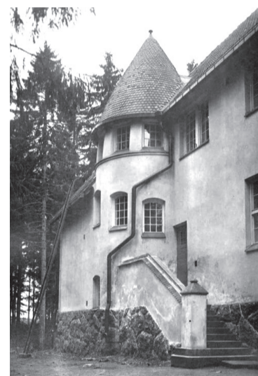
Так выглядела усадьба «Суур-Мерийоки» до Октябрьской революции

В ближайших планах — записать аудиогид и запустить сайт музейного пространства, разработать приложение, которое позволит увидеть историческое здание в виртуальной реальности. Чтобы привлечь внимание к уникальной флоре, активисты мечтают организовать в парке экотропу. На лето 2022 года здесь запланирован фестиваль «Утраченные усадьбы Выборга».