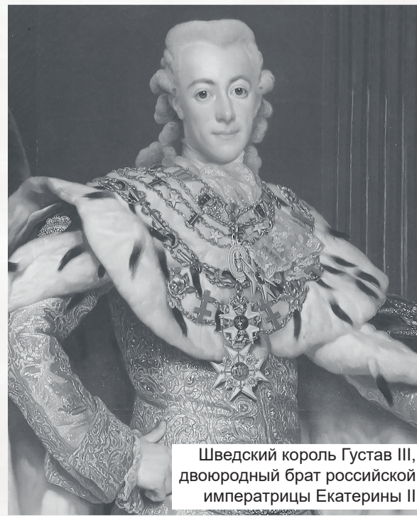
Шведский король Густав III, двоюродный брат российской императрицы Екатерины II

гребной флот, усиленный у Тверминне вновь построенными судами, 12 июня соединился у острова Соттунга с гребными судами Кейта и направился к берегам Швеции для высадки десанта. Но 18 июня было получено известие о том, что 16 июня в