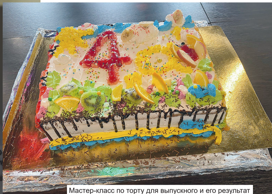
Мастер-класс по тарту для выпускного и его результат