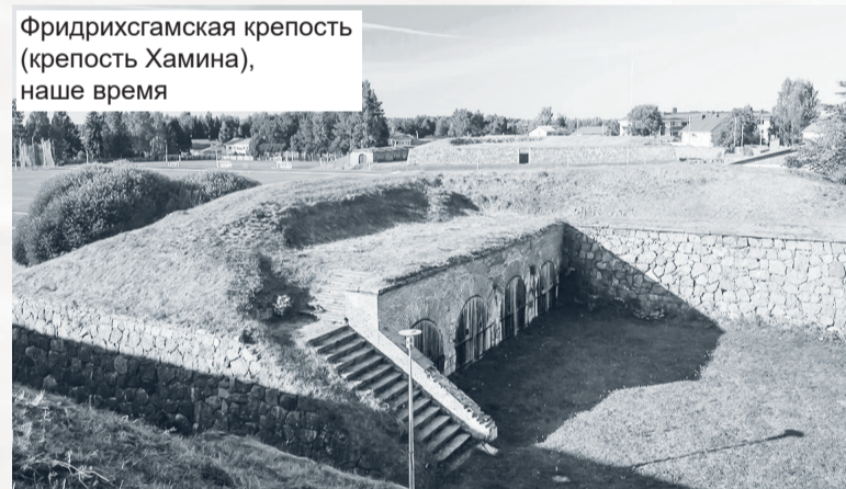
Фридрихсгамская крепость (крепость Хамина), наше время